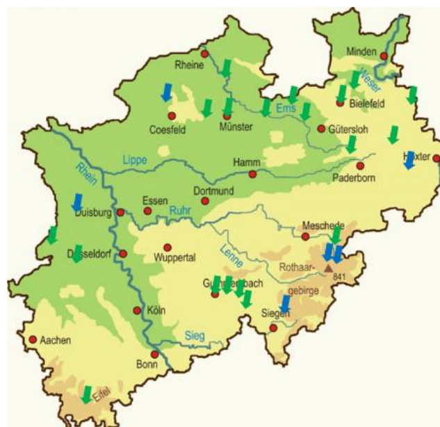
Abbildung 1: Geografische Verteilung der durchgeführten Vor-Ort-Gespräche und Remote-Audits (blaue Pfeile = Vor-Ort-Gespräche; grüne Pfeile = Remote-Audits).

Vor dem Hintergrund begrenzter Ressourcen ist aber, hinsichtlich der räumlichen Verteilung, nicht zuletzt die Sicherstellung eines effizienten Vorgehens handlungsleitend. Die nachfolgende Abbildung zeigt die räumliche Verteilung der durchgeführten Vor-Ort-Gespräche und Remote-Audits. Die Liste der auditierten Betriebe ist in Anlage 1 dargestellt.